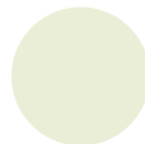
Ruhiges Salbeigrün Nr. 30