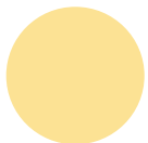
Freundliches Goldgelb Nr. 11