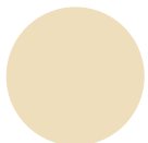
Belebendes Champagnergelb Nr. 13