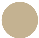
Verträumtes Wüstengelb Nr. 14