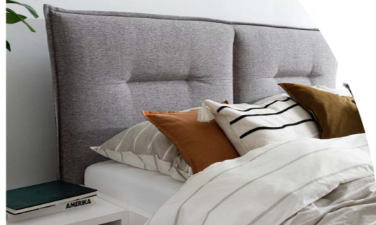
9151 Bezug grau