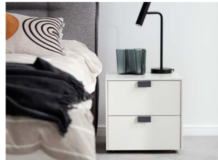
Konsole, zwei Schubkästen 45 cm