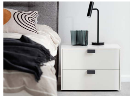
Konsole, zwei Schubkästen 60 cm

Wenn Schrank und Bett so viel Charakter beweisen, dann sollte die Kommode erst recht mit ungewöhnlicher Optik punkten. Die MISENA Kommode ist ein echter Hingucker und fügt sich harmonisch in das Gesamtbild des Raumes ein, während sie gleichzeitig praktischen Stauraum bietet.