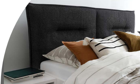
9150 Bezug schwarz