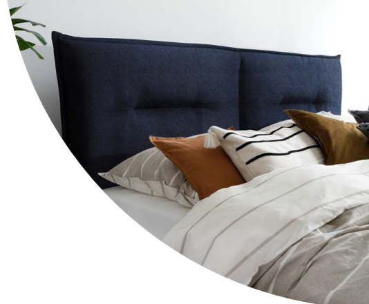
9152 Bezug blau