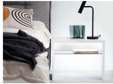
Nachttisch U-Form ohne Rückwand 60 cm