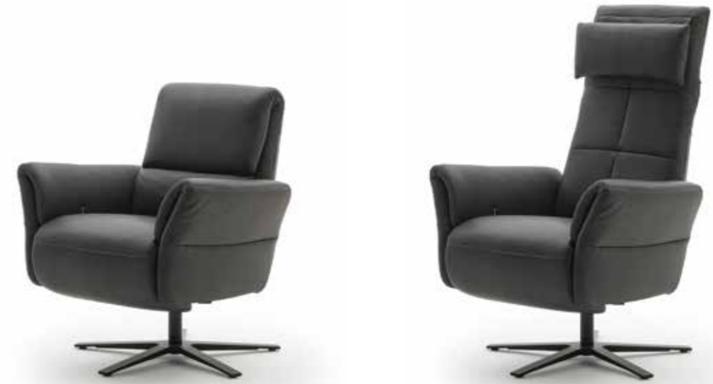
SALERNO FLEXLINE mit Hochstellrücken