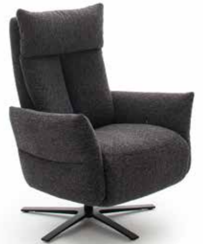
IMPULS LAZYLINe Variante 4

Wer die Vielfalt oder einen Solisten sucht, der wird im Programm des Sesselsystems IMPULS LAZYLINe fündig. Unterschiedliche Rücken-, Armlehn- und Untergestellvarianten bilden ein Baukastensystem, aus denen Sie einen Relaxessel nach Ihrem Geschmack zusammenstellen können. Alle Modelle verfügen zudem über 3 Sitzhöhen und 3 Sitztiefen, damit sich der Relaxer perfekt an Ihre Körpergröße anpasst. Bequemer geht's nicht.