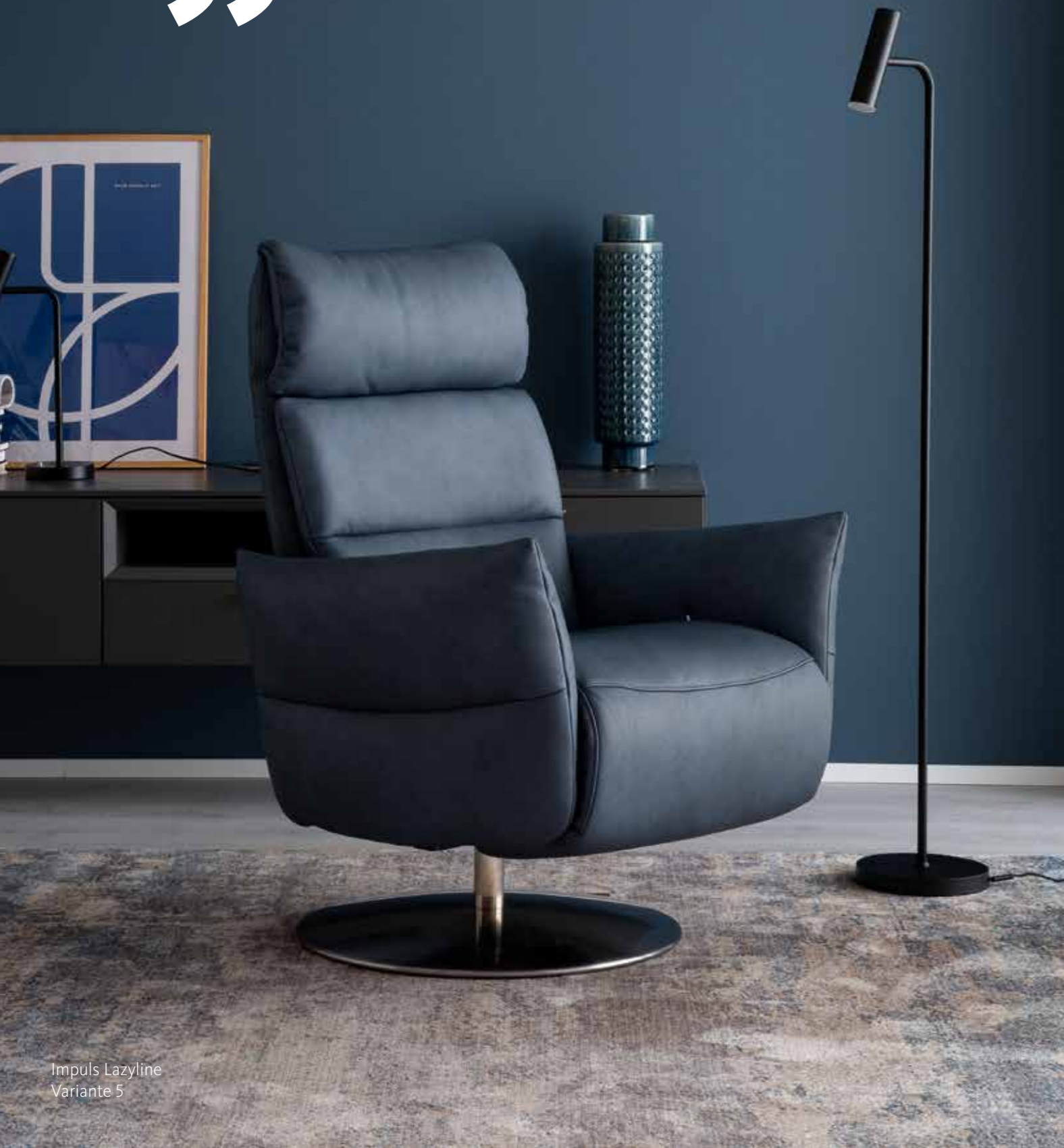
Impuls Lazyline Variante 5