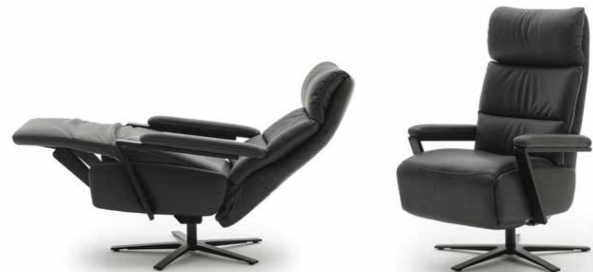
IMPULS LAZYLINe Variante 8