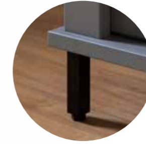
Puristischer Möbelfuß, schwarz matt