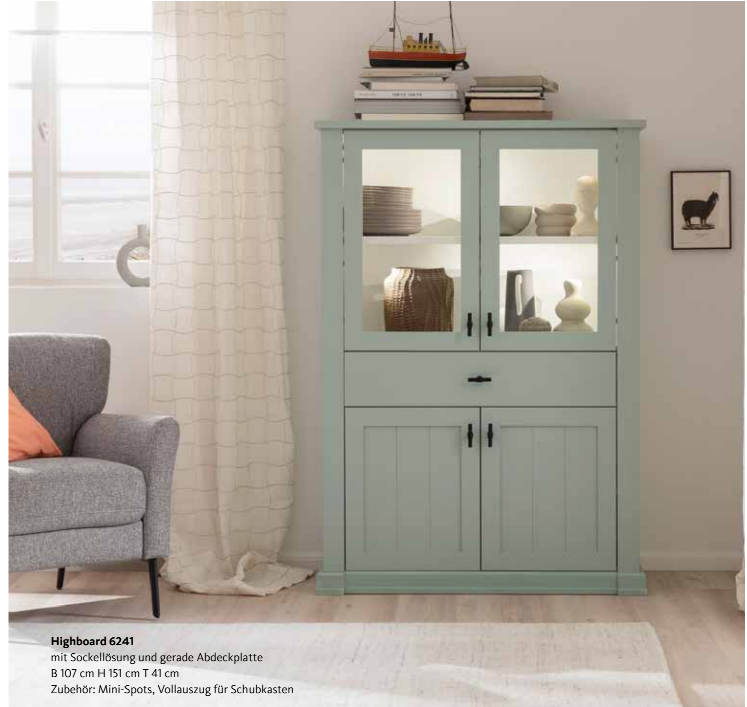
Highboard 6241 mit Sockellösung und gerade Abdeckplatte B 107 cm H 151 cm T 41 cm Zubehör: Mini-Spots, Vollauszug für Schubkasten