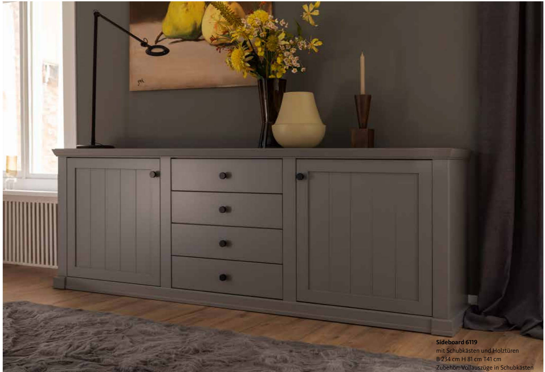
Sideboard 6119 mit Schubkästen und Holztüren B 234 cm H 81 cm T 41 cm Zubehör: Vollauszüge in Schubkästen