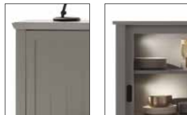
Profilierte Abdeckplatte Gerade Abdeckplatte

SCHRITT 5: WÄHLEN SIE: SOCKEL ODER FÜSSE