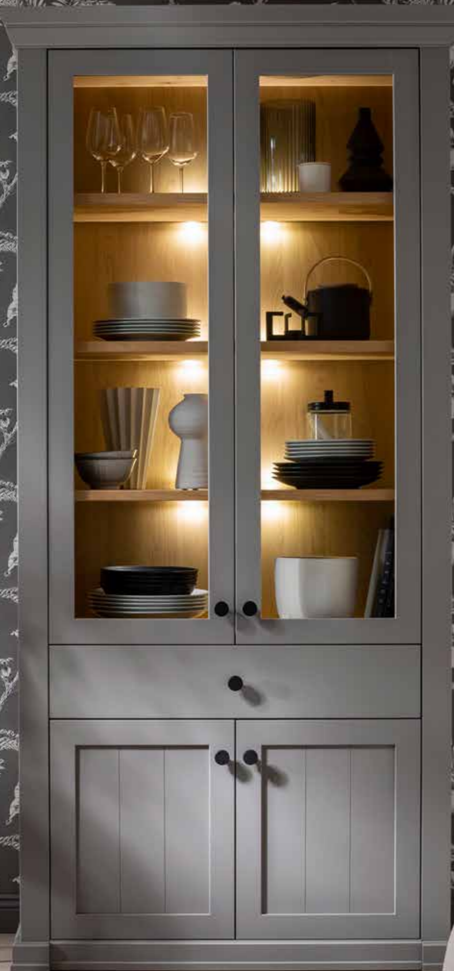
Vitrinenschrank 6331 H mit Vitrinen-, Holztüren und Schubkasten B 110 cm H 228 cm T 43 cm Zubehör: Holzbodenbeleuchtung