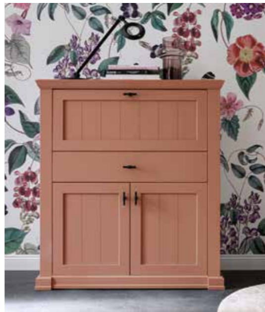
FARBAUSFÜHRUNG LACK BERRY