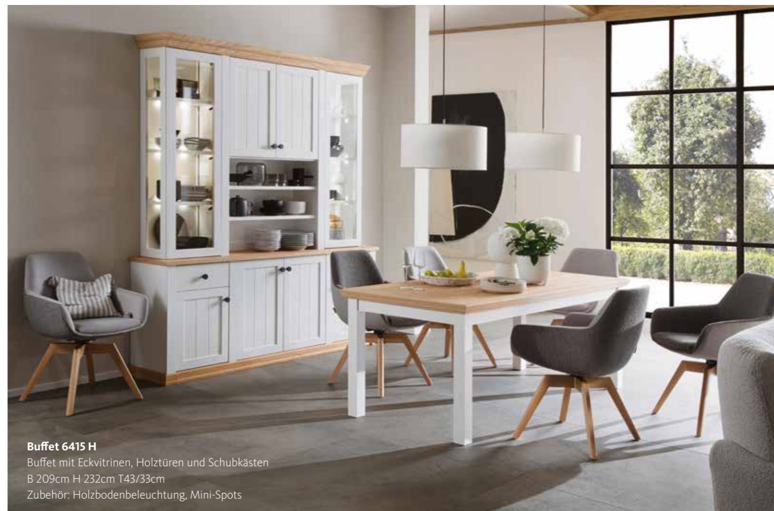
Buffet 6415 H Buffet mit Eckvitrinen, Holztüren und Schubkästen B 209cm H 232cm T43/33cm Zubehör: Holzbodenbeleuchtung, Mini-Spots