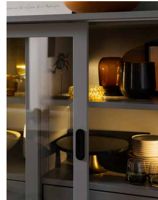
Schiebetür mit Muschelgriff aus Edelstahl, schwarz matt