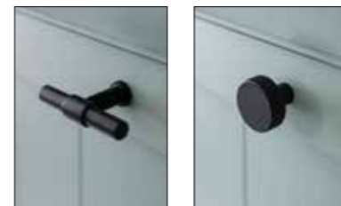
Griff SW1 Edelstahl schwarz Griff SW2 Stahl schwarz, pulverbeschichtet