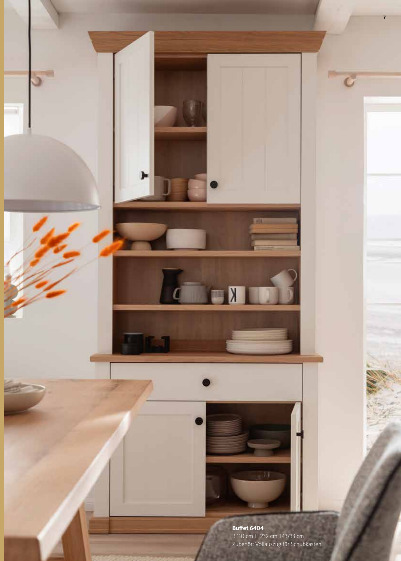
Buffet 6404 B 110 cm H 232 cm T43/33 cm Zubehör: Vollauszug für Schubkasten

SPEISERÄUME “ ZUM ESSEN, FEIERN, DISKUTIEREN ” UND LACHEN.