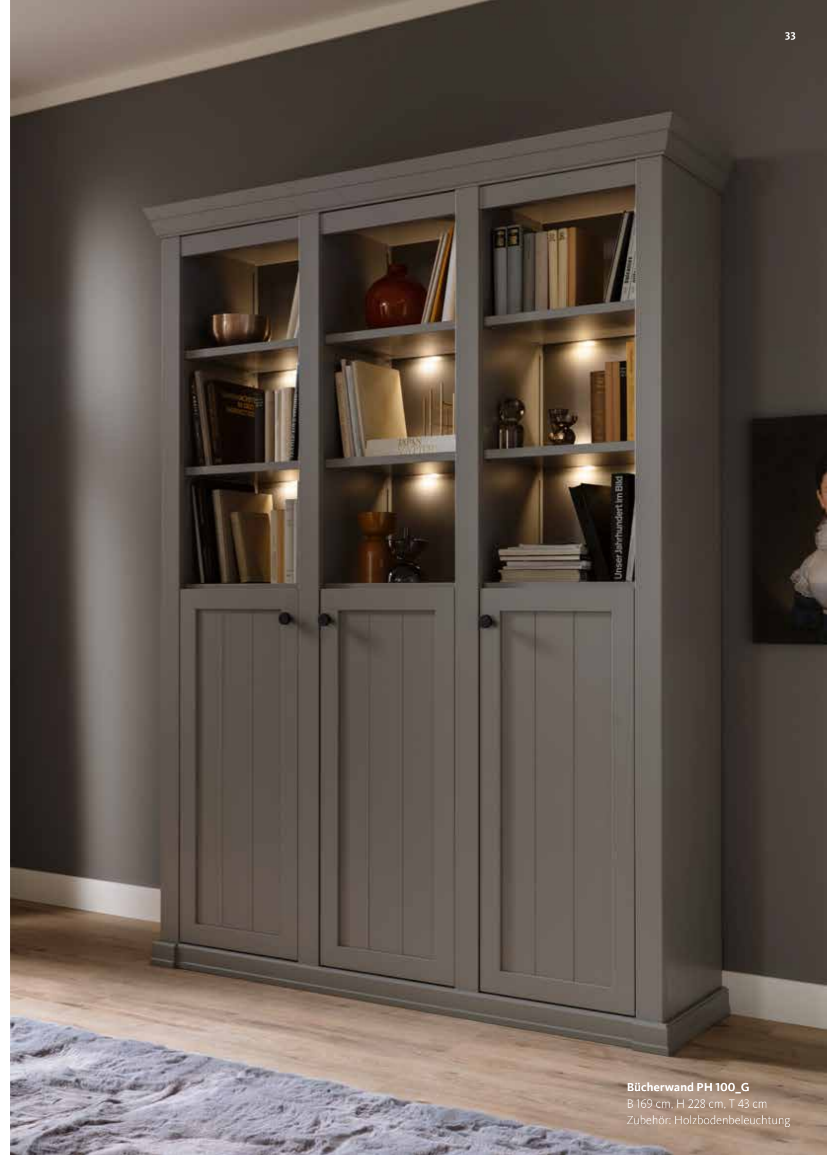
Bücherwand PH 100_G B 169 cm, H 228 cm, T 43 cm Zubehör: Holzbodenbeleuchtung