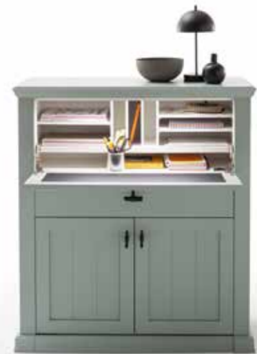
FARBAUSFÜHRUNG LACK SALBEI