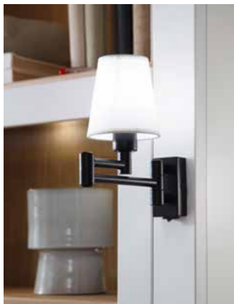
Pilasterleuchte mit Schirm