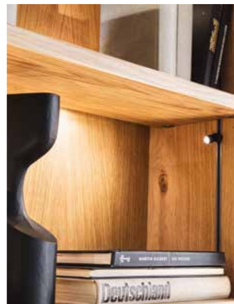
Einglassene Stromschiene mit Mini-Spot Größe: 3,2 cm, Ø 1,6 cm