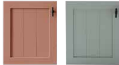
Lack berry Lack salbei

SCHRITT 2: WÄHLEN SIE DIE FARBE FÜR DEN KORPUS INNEN