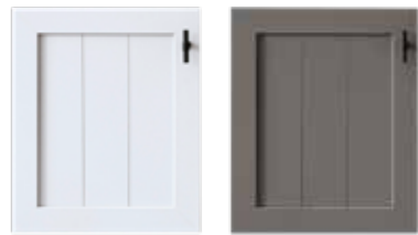
Lack weiß Lack stone

SCHRITT 1: WÄHLEN SIE DIE FARBE FÜR DEN KORPUS AUSSEN INKLUSIVE FRONTEN